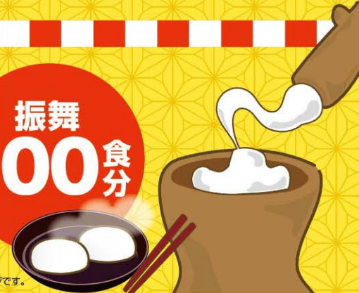
*イラストはイメージです。